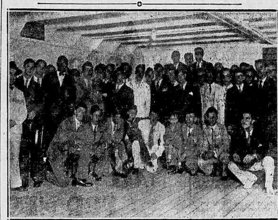
A partida da embaixada rubro-negra

Está a estas horas a caminho do sul, demanda a Montevideo, a brilhante delegação de amadores do Club de Regatas do Flamengo.